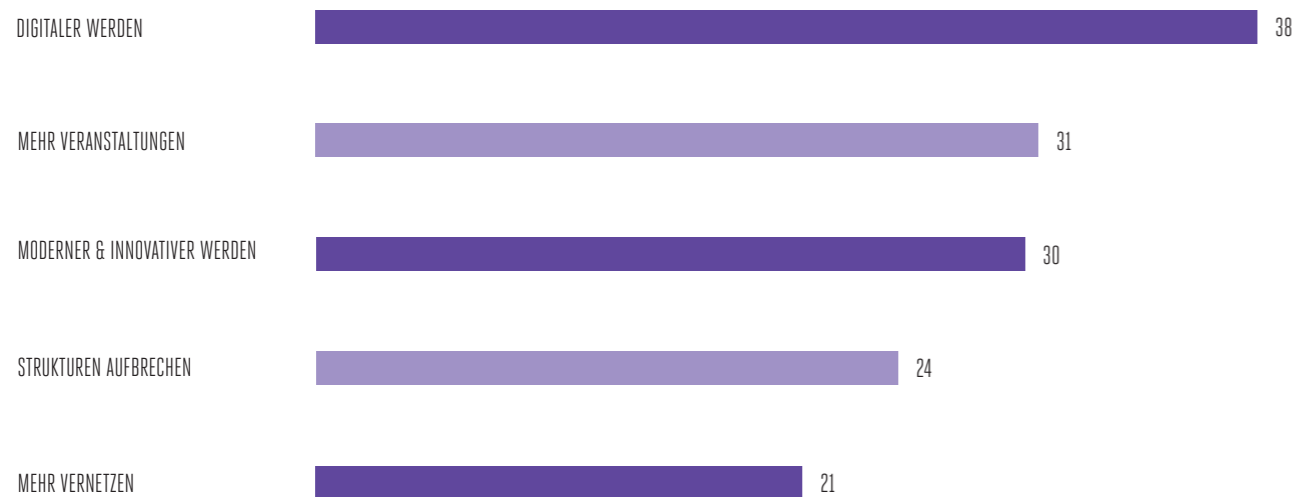
Abbildung 2, sortiert nach Anzahl der Nennungen