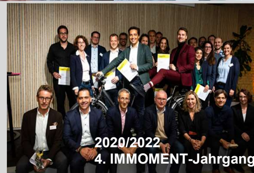
2020/2022 4. IMMOMENT-Jahrgang