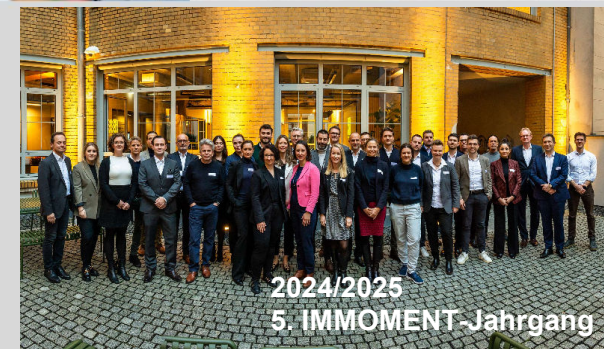
2024/2025 5. IMMOMENT-Jahrgang