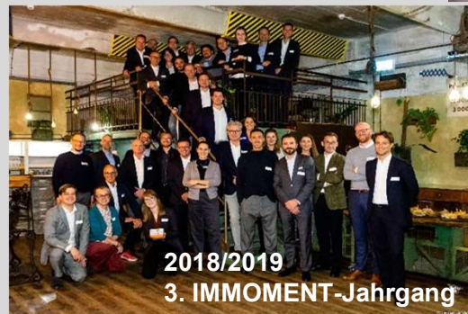
2018/2019 3. IMMOMENT-Jahrgang