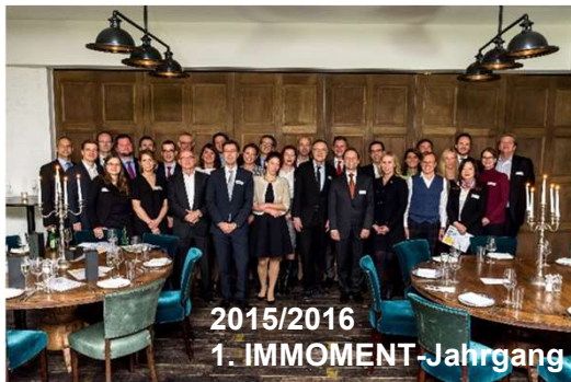
2015/2016 1. IMMOMENT-Jahrgang