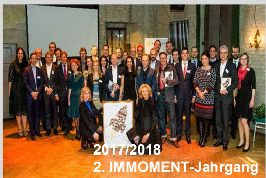
2017/2018 2. IMMOMENT-Jahrgang